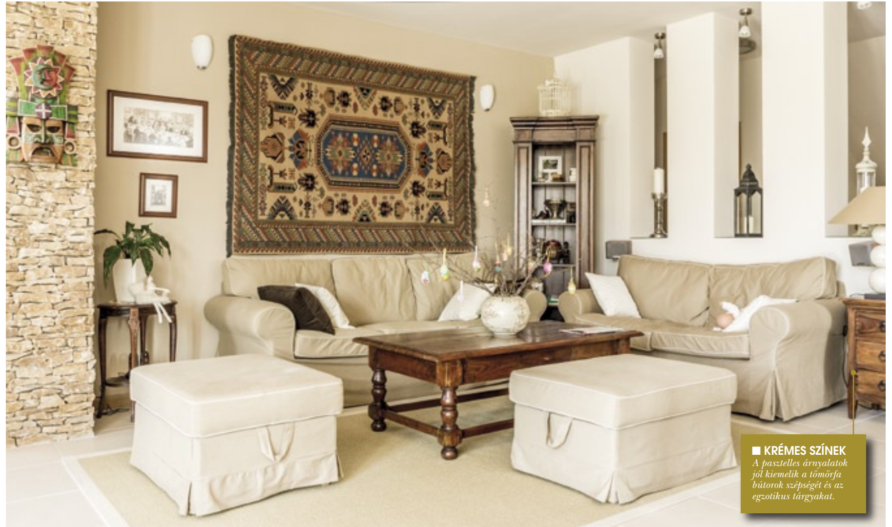
■ KRÉMES SZÍNEK A pasztelles árnyalatok jól kiemelik a tömörfa bútorok szépségét és az egzotikus tárgyakat.

Az emeleti rész közlekedőjéből nyílik a három szoba, és a hozzájuk tartozó WC és fürdő helyiség. Két szobához kis tetőterasz is kapcsolódik. Biztosítva ezzel mindenkinek a kellő intimitást és a kerttel való közvetlenebb kapcsolatot. A szobák hangulata a lenti élettér stílusát követve a régmúltat idézi modernebb kivitelben. Az antik dísz tárgyak és kisebb bútorok harmonikus egysége hosszú gyűjtőmunka eredménye.