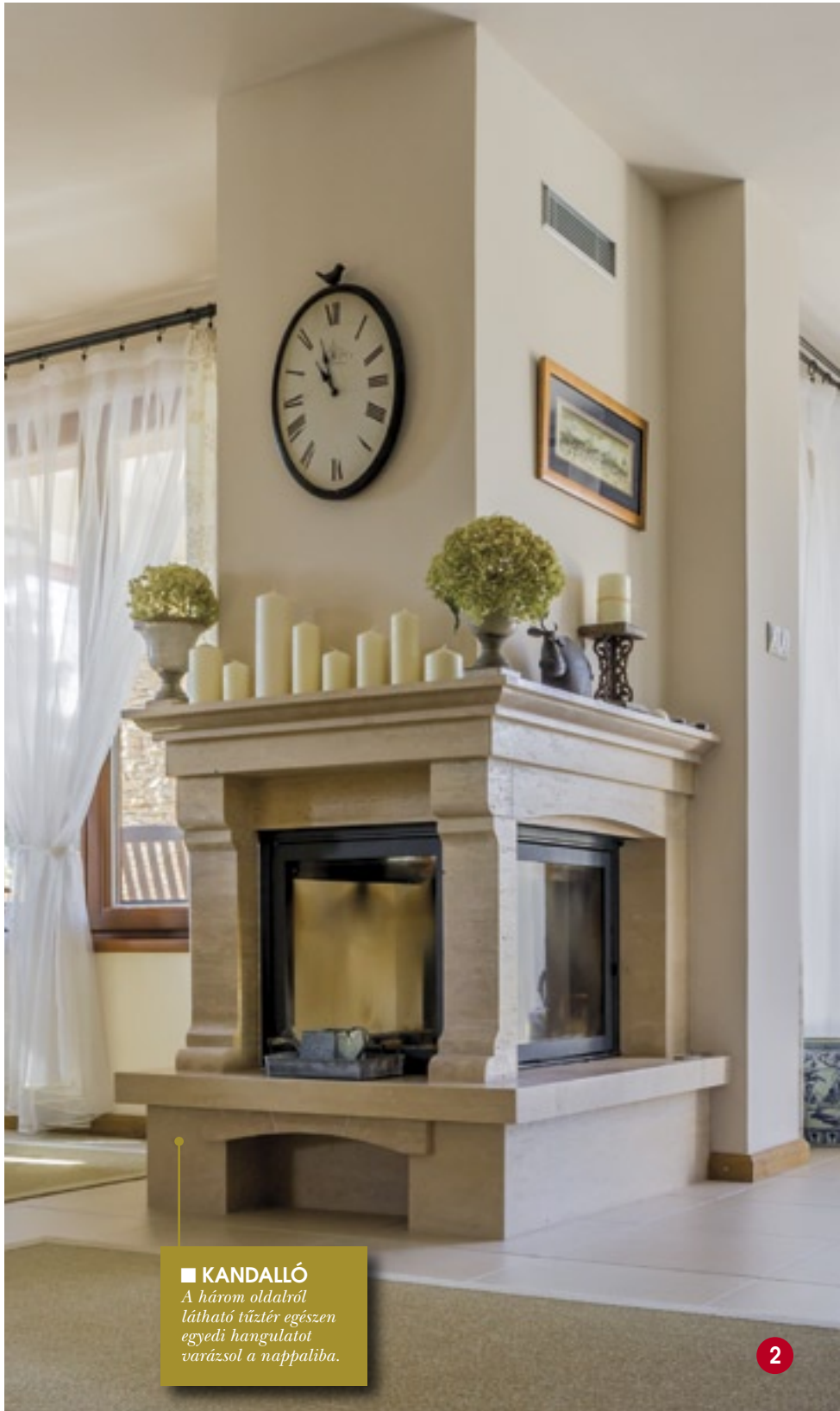
■ KANDALLÓ A három oldalról látható tűztér egészen egyedi hangulatot varázsol a nappaliba.